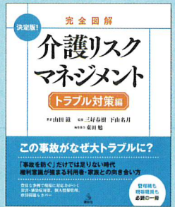
⑥ 完全図解 介護リスクマネジメント 【トラブル対策編】 著：山田滋 発行：講談社 定価：3,200円+税 / AB判