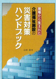
③ 現場から生まれた 介護福祉施設の 災害対策ハンドブック 著：山田滋 発行：中央法規出版 定価：2,800円+税 / A4判