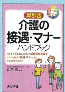
④ 介護の 接遇・マナー ハンドブック 監修：山田滋 発行：ナツメ社 定価：1,700円+税 / A6判