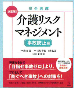
⑤ 完全図解 介護リスクマネジメント 【事故防止編】 著：山田滋 発行：講談社 定価：3,200円+税 / AB判