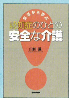
② 生活から学ぶ 認知症のひとの 安全な介護 著：山田滋 発行：プリコラージュ 定価：1,200円+税 / A5判